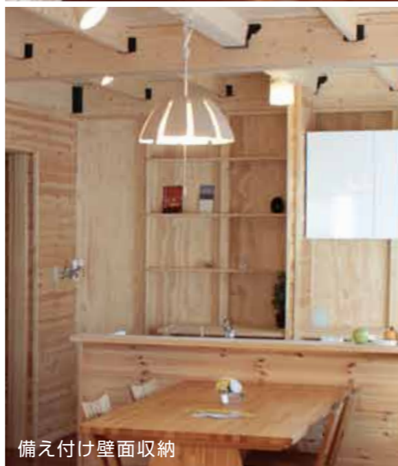
備え付け壁面収納