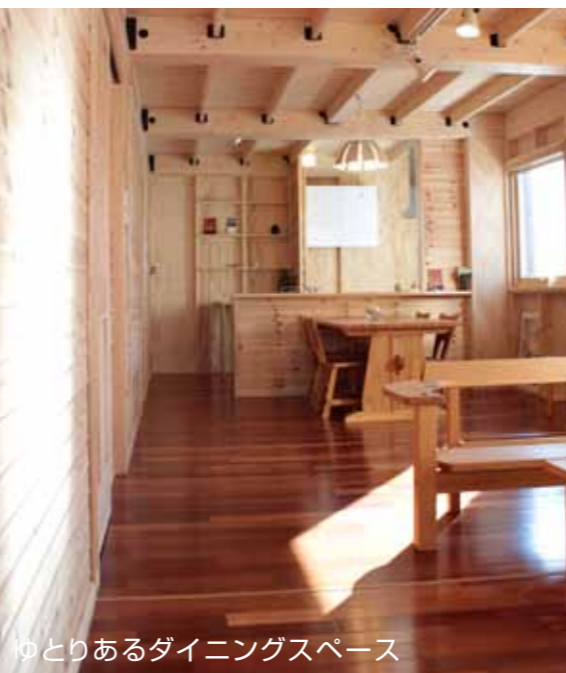
ゆとりあるダイニングスペース