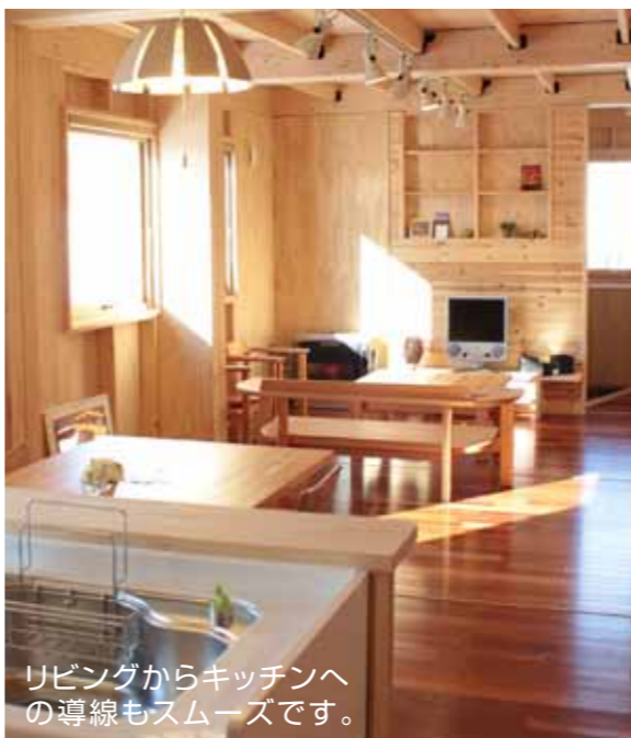
リビングからキッチンへの導線もスムーズです。