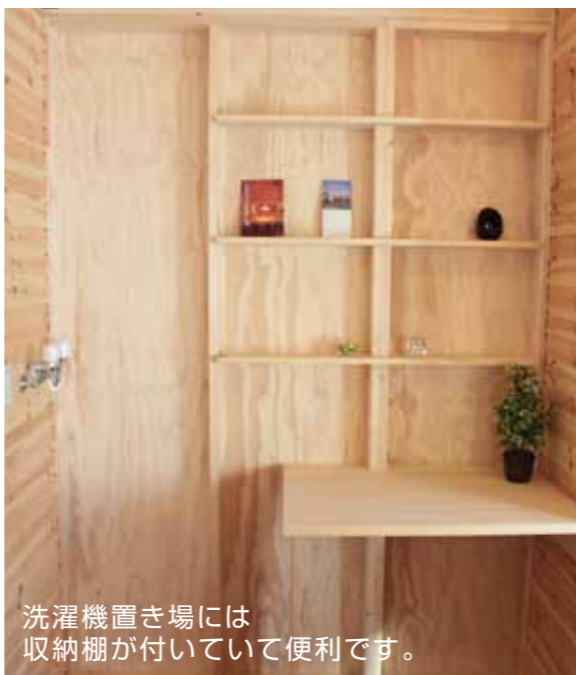
洗濯機置き場には収納棚が付いていて便利です。