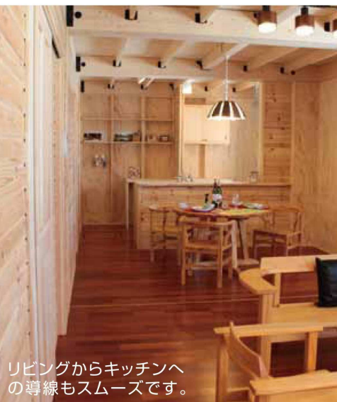
リビングからキッチンへの導線もスムーズです。