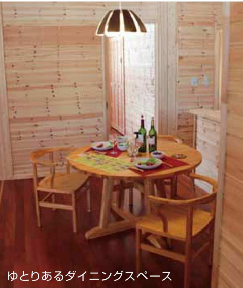
ゆとりあるダイニングスペース