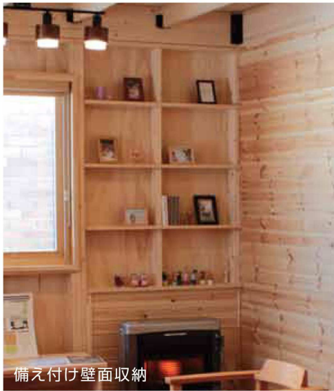
備え付け壁面収納