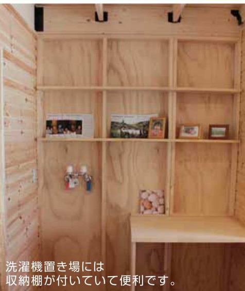
洗濯機置き場には収納棚が付いていて便利です。